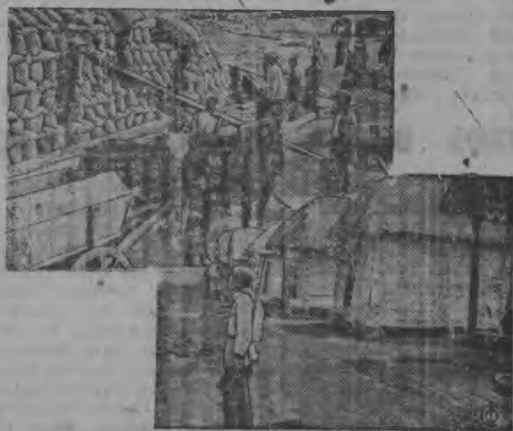
ВЫЛ'ЯЗ — Колхозник'ёс кысьсан пунктэ нянь кыскало УЛ'ЯЗ — нянь кыскан колхоз кенос'ёсы колхозник'ёс вöвмало.

Кудйэ колхоз'ёс етйнэз вузлы пörмытон уже болшевик мылкыдон кутскыны. Чабырово сельсоветысь «Новый Труд» колхоз, етйн сестыкуз туж юн качествоз выдэ жутон понна нур'ёсыкэ. Нырись сётон нуралэ 6 номерен гинэ етйн качествозэс потто вылам. Нош качествоз выдэ жугыны понна производственной совещани лэсьтыса но соя сэткысьёс пöлын валектон пуктыса 12 номеровэ качество вуиз, нош кинке одйг номерлы качествозэ выдэ жутэ ке 0,1 груддөн ватса нош одйг номерлы сестыкэ етйн номерэ кулэстэ ке 0,25 трудоден синаёто. Тйни сыче уж'ёс лэсьтыса ужамлэн бервылэс но вань, 13 номеро етйн 10 ударстволы вузаны. Сыче болшевик мылкыдо ужам амал быдэс ёросэ вöлдыса ужано.