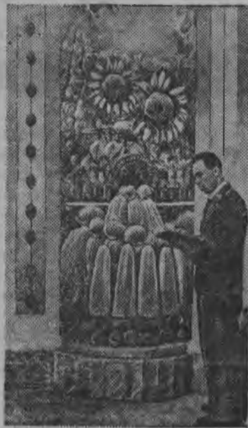
„Сибирь“ павильонлэн залаз технической культурыослэн стэндзы.

Всесоюзной сельскохо- зяйственной выставканы.