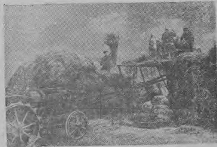
„Червоная Горка“ колхозын жег кутсало (БССР-ысь, Дзержинской район).