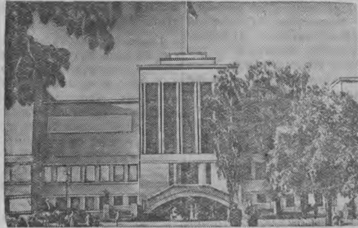
Каунас карысь государственной музей