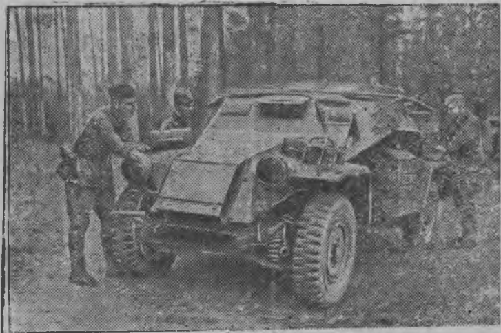
Трос трофеяос пöлын боецъёсын басытэм немецкой бронемашина. (Западной направление).