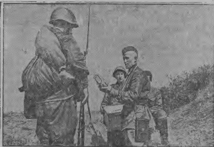
Азись позициосын трудящыйёслэсь подарок'ёссы боец'ёслы с'ётыан. (Западной направлении).