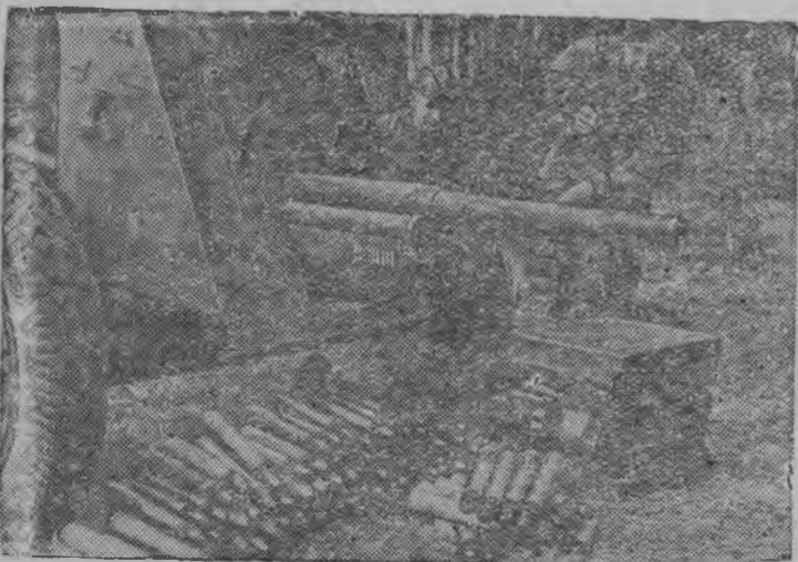
Асьме частьёсын басьтэм немецкой пушка.