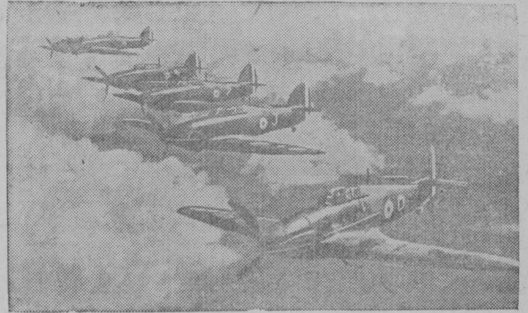
Авгильскёй бомбардировщикьяс полётын.