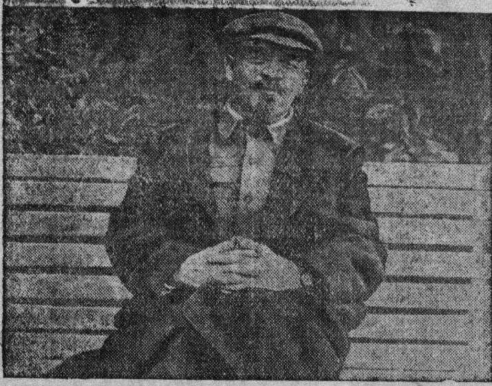
Снімок вылын: В. І. Ленин Горкаын отдых вы- лын (1922 во).

Janvar 21-od luno tyris 15 vo velikoj učitel da proletariatlbn genjalnoj vojđ Vladimır Iljič Lenin (Uljjanov) kuldomsan.