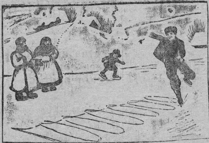
—Виӧдлы, кызи Колкаыс миллионјассӧ гижалӧ... —Кыз нӧ сылы абу привыкајтны, сизӧ ӧд мијан колхозын ужалӧ счетоводӧн. Бантле јорт тема куза, В. Барковлӧн рисунк Бјуро кӧшо ТАСС.