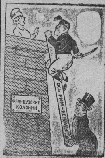
Англіја поддөрживајтө Італіјалыс Франціјакөд „ма- тыстчөм“ куза зілөм. Художнік В. Лівөвічлөн фото. ТАСС-лөн Бјуро-көше.