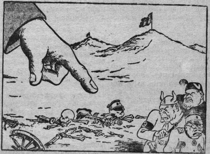
„С6ветск6й каравај выл6 воит6 ен паск6длы.“ Г. Валк6н да В. Лисевич6н рисунк. ТАСС-л6н бјуро-к6ше.