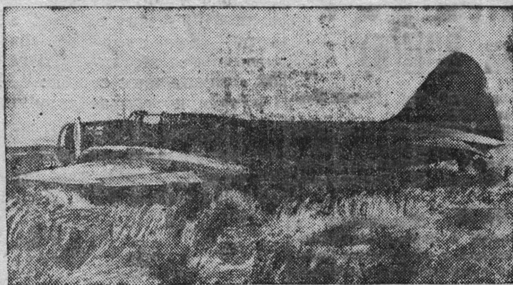
СНІМОК ВЫЛЫН: „Москва“ самолет Міскоу ді вылын.

Москва—Војвыв Амеріка костса пуксывылөтөм лөбөдмлы.