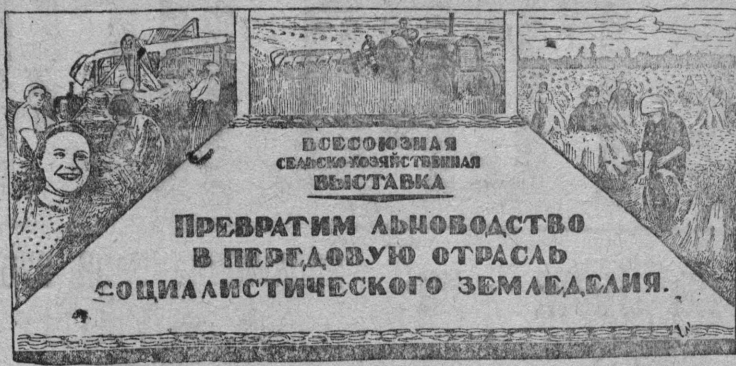
СНИМОК ВЫЛЫН: В. Т. Клинич да Б. М. Фридкин художникъяслн плакат, код ладзбма Ставсоюзса Сельскохознајственной Выставкалн главной комитетлн.