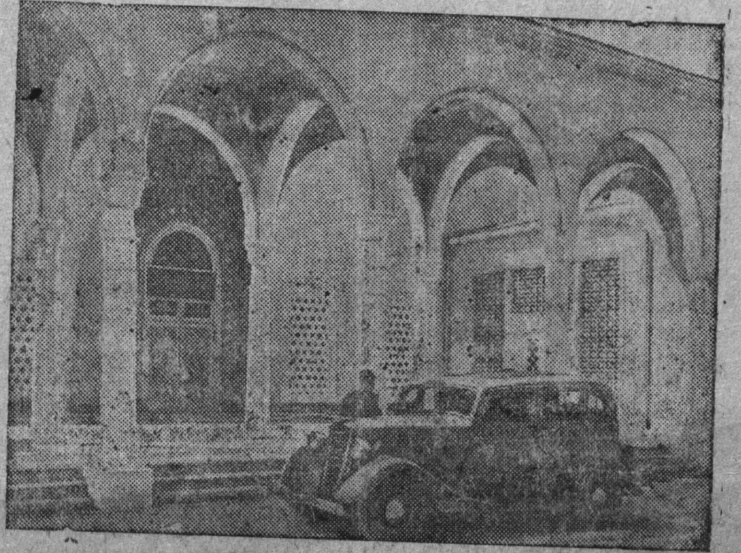
СНИМОК ВЫЛЫН: Татарскбй АССР-са павильонысь порталлбн да двориклбн фрагмент.

Ставсоюзса Сельскохозяйственной Выставка ВЫЛЫН.