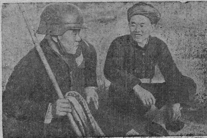
СНИМОК ВЫЛЫН: Фронт бердса öти сиктысь крестьянин беседуйтö китайской армияса фронт выlö петьсь боецкөд (Хунань провинция).