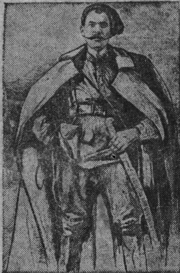
В. И. Чапаев. Художник П. Васильев-лӧн рисунок.

Гражданской войныса герой, мян рӧдинаса пламенной патриот—В. И. Чапаев куломсян 20 во тыриг кежлӧ (1919 во, сентябрь 5 лун).