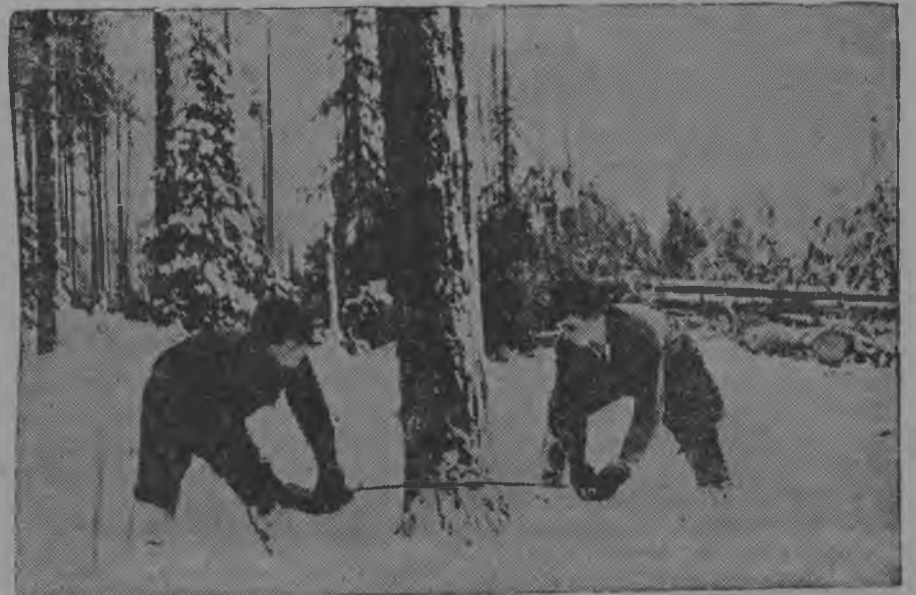
Стахановецјас І. Верешшагїн да В. Важнїчїј пօрօддны којмօд сурс кубометрыс первојја пу.