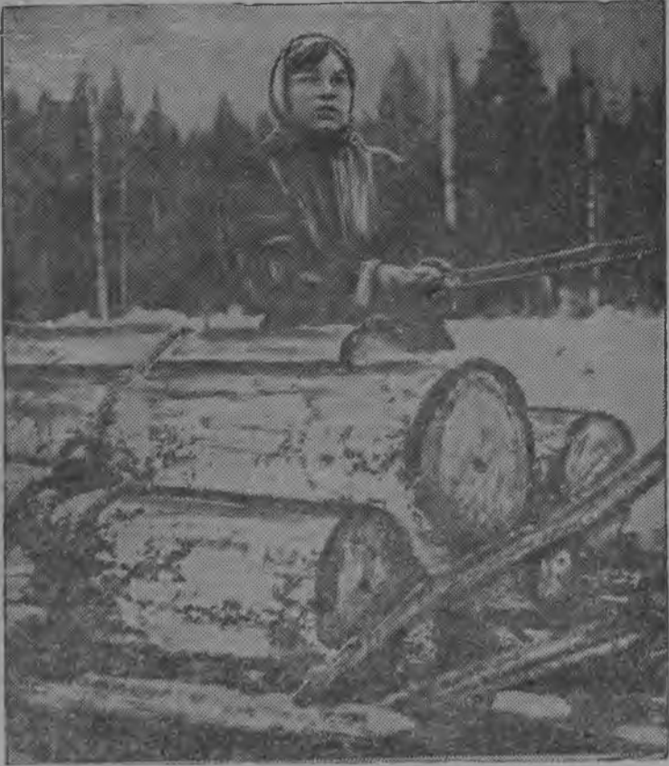
Літуй куза М. М. Габова кыскалѣ вѣр.