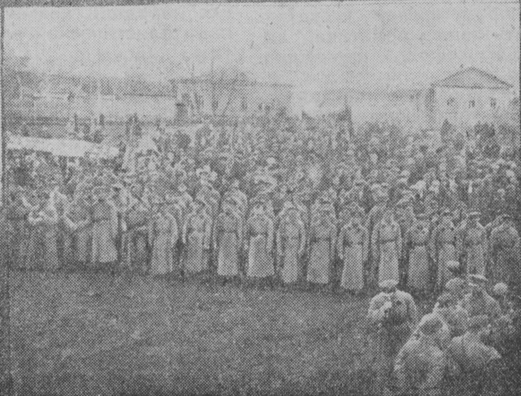
1-це снимкаса якстерь партизаттне, 2—милициянь батальонць, 3—демонстрацият- тне, 4—демонстранттне и 5—гарнизононь часць.