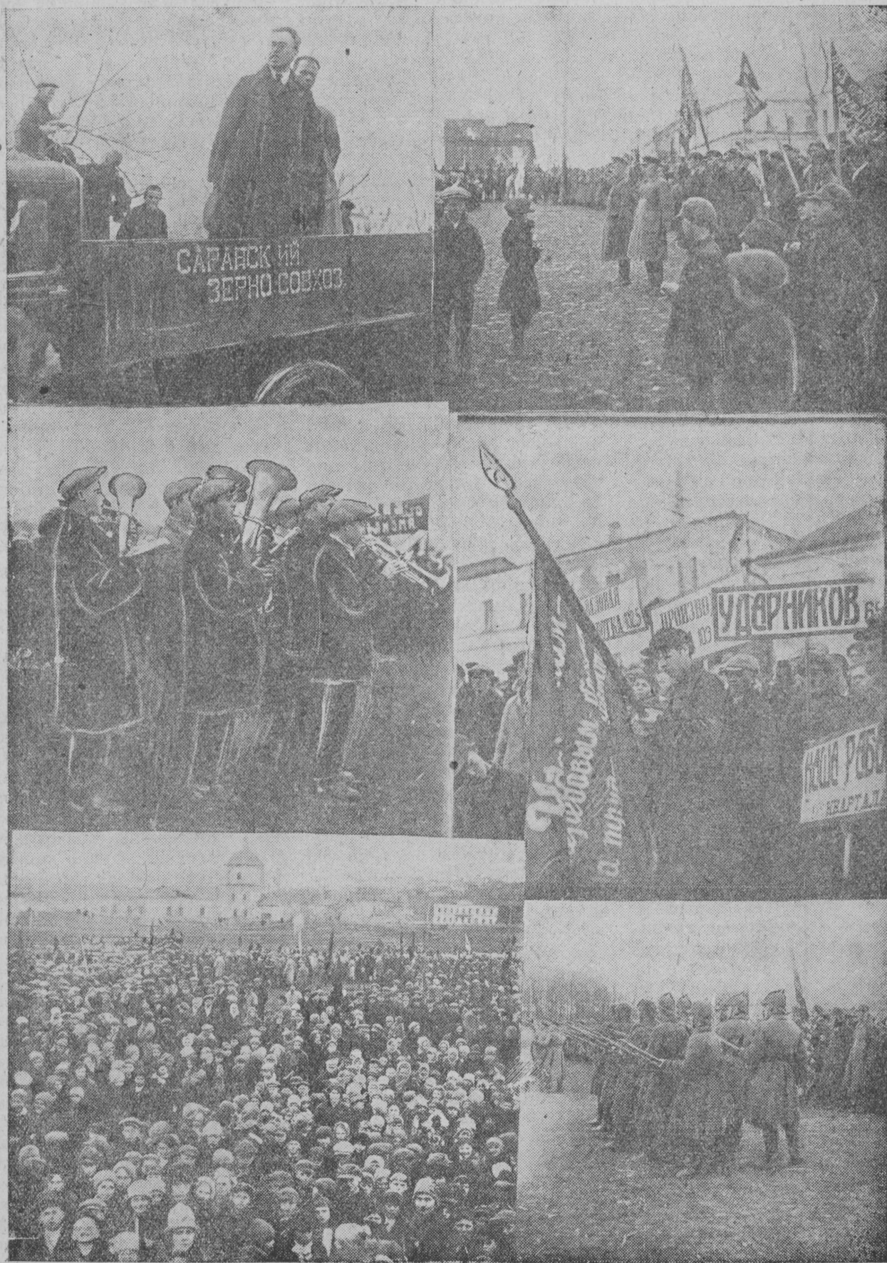
1-це снимкаса МОПР ать председателец, 2-це — прьмайхть парад, 4—типографиянь ударникне, 5—демонстрантне, 6—прьмайхть присяга.