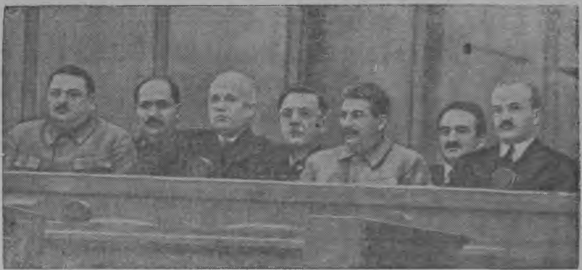
Партияса да правительствоса руководителъяс Союза Советлн да Национальностей Советлн бтувъя заседание вылын. Шуйгавысыянь веськыдвылб: А. А. Жланов, Л. М. Каганович, Н. С. Хрущев, К. Е. Ворошилов, И. В. Сталин, А. И. Микоян да В. М. Молотов бртъяс.

— Кутам выполняйтны лунъя графикъяс!—висьталб шофер-стахановец. И сибб асыыс кывсб делб вылын подтверждайтб.