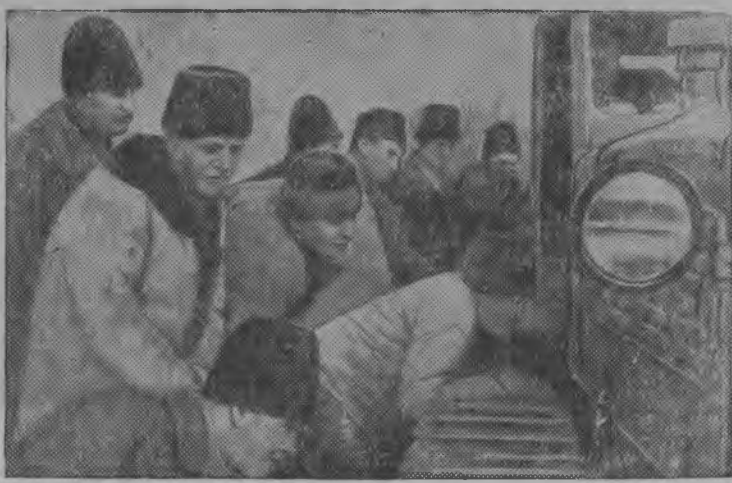
„Новая жизнь“ сельхозартельса колхозникъяс (Бендерской уезд, Молдавской ССР) виллалоны первой трактор, кодэ воис колхозын уджалом выло.

В. ПЫСТИН, Осоавиахим райсбетса председатель.