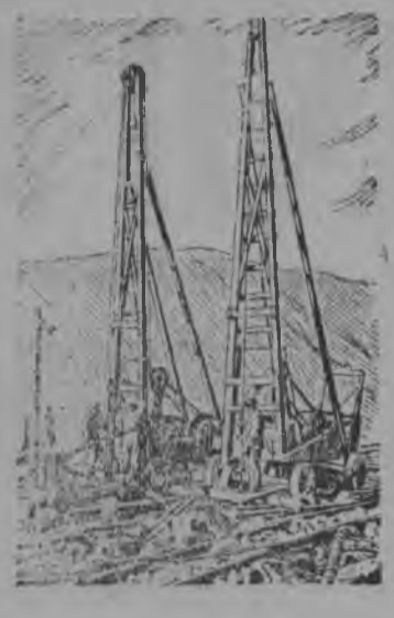
Серпас вылын: Бурлбной станциjас (Кировск кар. Мурманской области) дiстбны скважинаjас аммонитбн рудajас взривajтбм вылб.

накбд эз мун некутшбм удж. Большевизмбн овладейтбм, кызди индб ВКП(б) ЦК, лыддылысны позныс верманадн сбмын нецжыд круглы. Ми кбсыам велбдчыны сiдз-жб, кызди велбдчыны великбј вождьjас Ленин да Сталин ёртjас. Собраниеjас муналысны и Паль сиктсбветувса „Красной Армия“, „1-ой Пятилетка“, „Ярбга“ да „Трактор“ колхозjасын. Колхозникjас ыджыд кыпыдлунбн обсуждайтiсны да чолбмалбны ВКП(б) ЦК-лыс постановление да петкбдлбны ыджыд кбсiдм вблбдны большевистской партиjалыс славной история. Шарыгин.