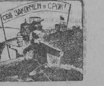
... едут по полю герои!...