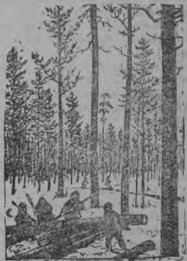
На снимке ударники лесорубы Тарасовской деревни—Лоймы.

Мукѣд сельсѣвету в нывбабас бѣвѣтѣѣ пример Занульѣѣѣ.