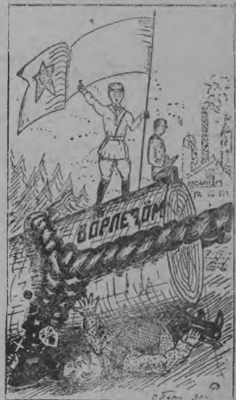
Комсомольчјас кыпөдөны гожеа вөр-лозан өд.

Нельзя, организовав колхоз, предоставить его самому себе, а должна быть со стороны партийной, сов. и проф. общественности обеспечено систематическое повседневное руководство и помощь. Классовые враги и их агенты, чем дальше, тем больше стараются вредить делу соц строительства, никогда не нужно успокаиваться на том, что если даже деревня или сельсовет сплошную коллективизированы — нет классовой борьбы, ничего подобного, наоборот, пока кулачество не ликвидирован как класс — на основе сплошной коллективизации, до тех пор она будет вести ожесточенную борьбу, принимавшую в отдельных случаях открытые контрреволюционные выступления (поджоги, убийства, избиения погравы и др.). Поэтому должна вестись повседневная беспощадная борьба с классовыми врагами, их агентами подкулачниками и оппортунистами и на основе этой борьбы, большевистскими темпами работ в порядке ударничества и соц. соревнования, усиления культ-массовой политработы. Среди батрацко беняцкой колхозной и середняцкой частью населения добиться успешного и полного выполнения всех хозяйственно-политических мероприятий и тем самым обеспечить новую волну колхозного строительства.