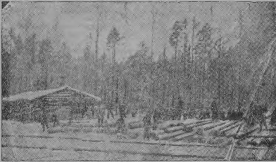
Вёрлезыеяс вёрлезан уж вылын.