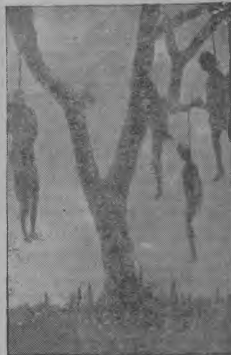
Серпас вылын: өшлөм негырјас.