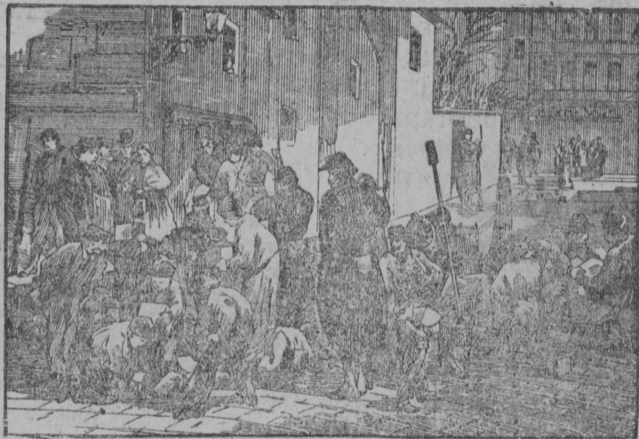
Парїжса улычтас пыщкыс бїтї вылын баррїкада стрїтїм.

Коммуналнї первој вос- ковнн вїлї важ, војенно- бїурократїческї госу- дарствениї машїнабє жу- гїдїм, кодї колї наследствїб И-бї имперїаыс. Полїцїја вїлї бїрїдїма: важ регу- лярнї арміја вїлї распу- стїтїма да вежїма став на- родбє вооружїтїмн; вїчко вїлї торїдїма государст- воныс, а вїчколыс імушчєст- во экспропрїрујтїма. Суд-