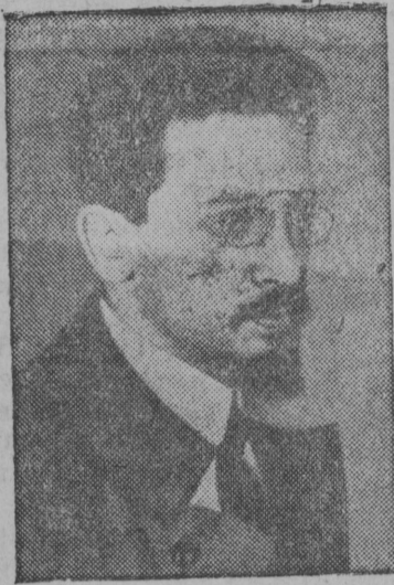
Снімок вылын: Ја. М. Свєрдлов.

Лєнінлөн — Ставінлөн вернї сораітнїк, мїжан пар- тіјалн да Сїветскї власт- лөн медбур організаторјас да вескїдлыјас пївсы бїтї ВЦК-са председател Јаков Мїхаїлович Свєрдлов кулїм лунсан (1919 во са март 16 лун) 20 во тырїг кежлї.