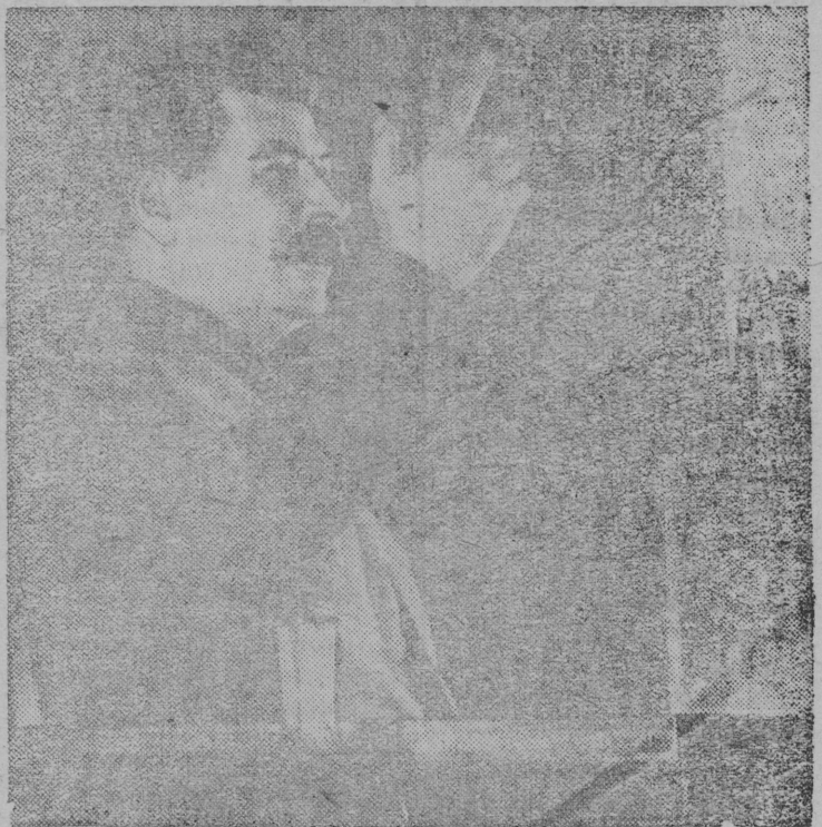
На снимке: И. В. СТАЛИН.

Отчетный доклад ЦК ВКП(б) на съезде сделает товарищ Сталин.