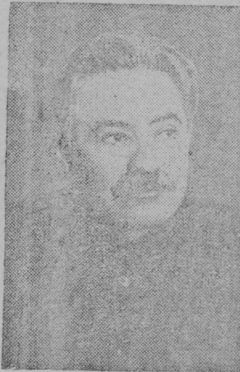
На снимке: Д. З. МАНУ- ИЛЬСКИЙ.

Отчетный доклад делега- ции ВКП(б) в ИККИ, сде- лает на с'езде тов. Ману- ильский.