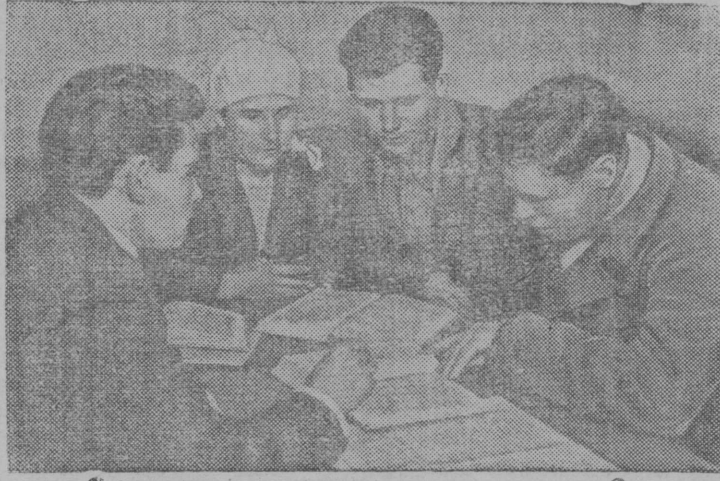
В парткабинете колхозного клуба.

Колхоз-миллионер имени Ленина (Чишимский район, Башкирская АССР) получил на ВСХВ 1939 году дип-лом 1 степени, 10 тысяч рублей и автомашину. Колхоз намечен к участию на ВСХВ 1940 г.