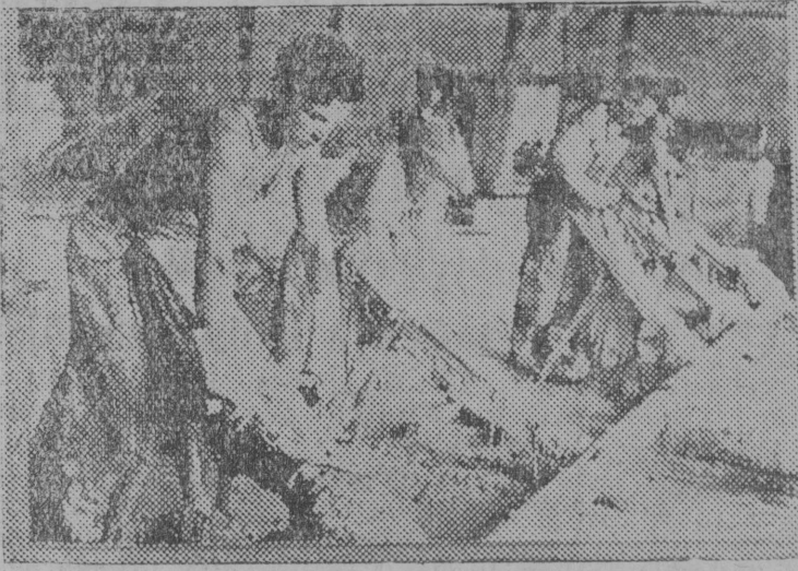
Устцілмаса замшбвбј заводын ужалан кад дырји