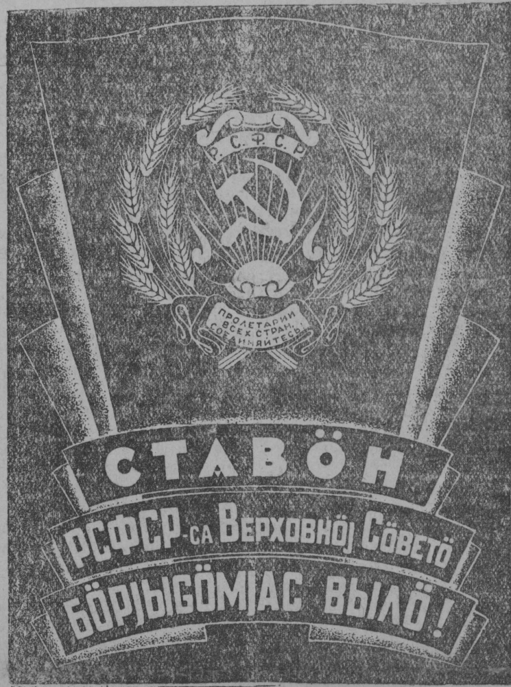
РСФСР-са Верховној Советө бөрјөсөмјас кежлө Изогїлөн лөдөм плакат.