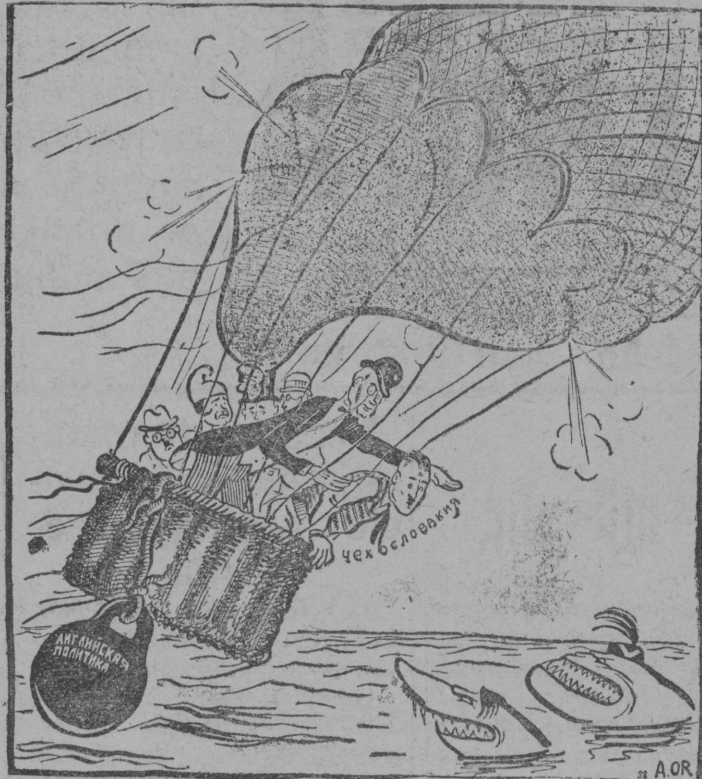
Англијскөй джентелмен: „Те-жө аған: сы өсна, медым мїјан шар вермис кутчыны воздухө, теныд колө чеччыны борт сәјө!“