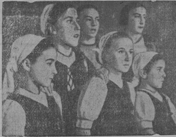
Снимок вылын: Баскскӧй нывјаслӧн хор, кодјас выступитисны ыҗыд успехӧн прачник вылын.

Парижӧ, республиканскӧй Испанија солидарност куза прачник былӧ локтисны баскскӧй томјӧз.