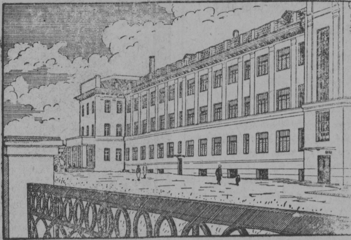
Рис. вылын: Гвердловскөй областса Березник карын въл полкльника