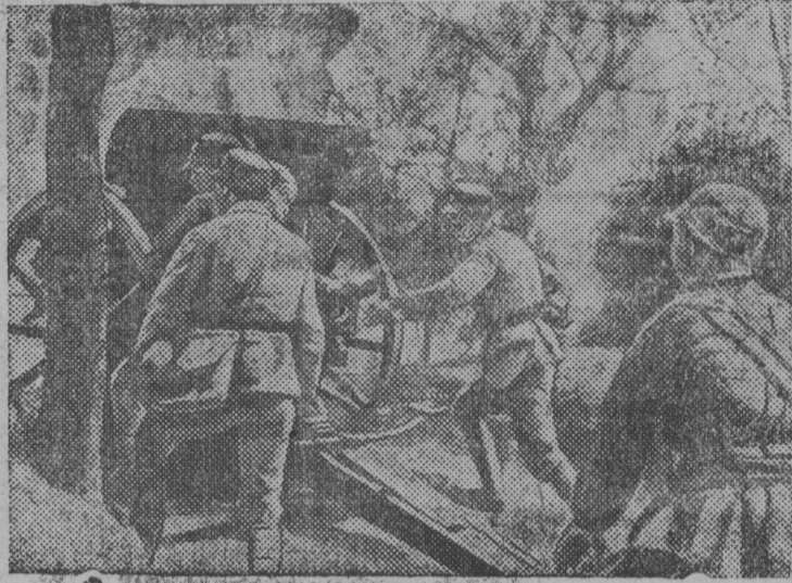
Сн. вылын: Китајскöй артиллерия позиция вылын.