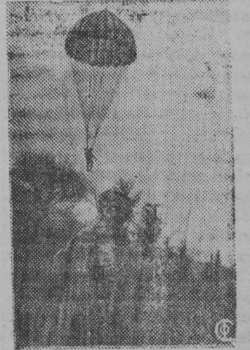
НА СНИМКЕ: у парашютной вышки в выходной день.

Парашютизм в Совет- ском Союзе превратился в массовый спорт. Пара- шютная вышка в гөрод- ском саду г. Тифлиса привлөкает большее ко- личество будущих пара- шютистов.