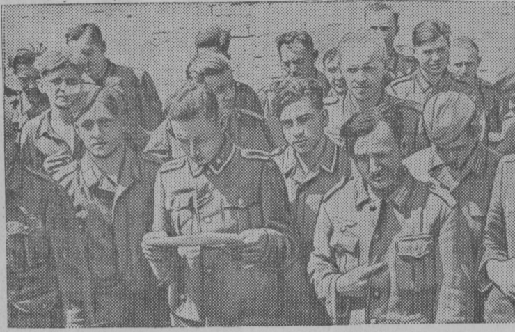
Группа пленных немцев.