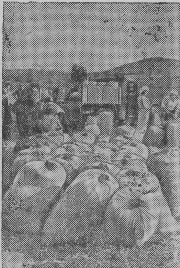
Колхоз имени ОКДВА (Спасский район, Приморье) первый в районе полностью расчистился с государством по хлебопоставкам. Погрузка последних центнеров зерна для отправки на эссыпункт.