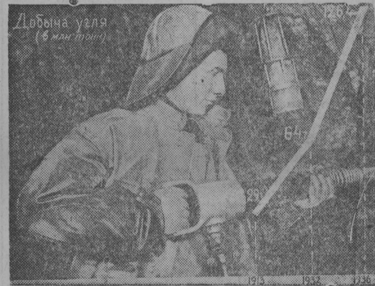
Добыча угля в СССР в сравнении с 1913 г. повысилась в 1936 г: по Донбасу—в 3 раза, по Кузбассу—в 22,2 раза, по Подмосковному бассейну—в 24 раза. На снимке: работа отбойным молотком в шахте № 5—6 им. Ворошилова (Кузбасс) и диаграмма добычи угля.