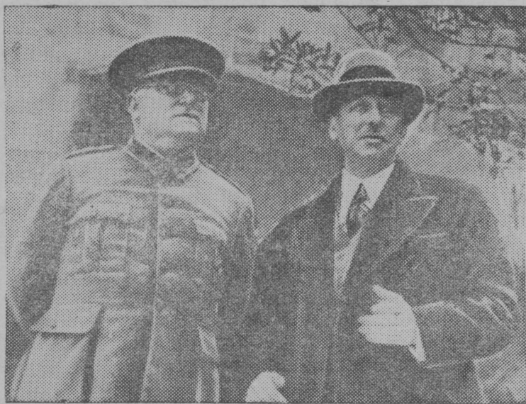
На снимке: Генерал Миаха и президент Каталонии Компанис (справа) в Барселоне.