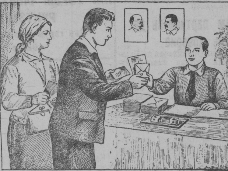
2. Етэ документсэ бэр'ись сетэ участковэй бэр'ян комиссиясь секретарлэ нето членлэ. Бэр'иссез список съэрти проверитэм бэр'ян да бэр'иссез списоккезын отметитэм бэр'ян, бэр'исьсыс получайтэ уставитэм образца бэр'ян бюллетеньда конверт.