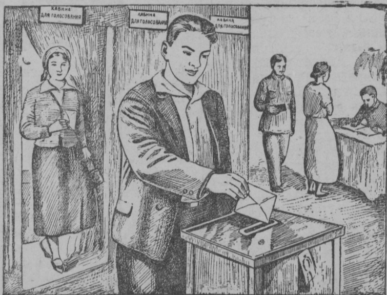
4. Бэр'ис мунэ мэдик комнатаз, кытэн пукалэ участковэй бэр'ян комиссия и л'едзз конвертсэ бэр'ян бюллетеньназ бэр'ян ящикэ.