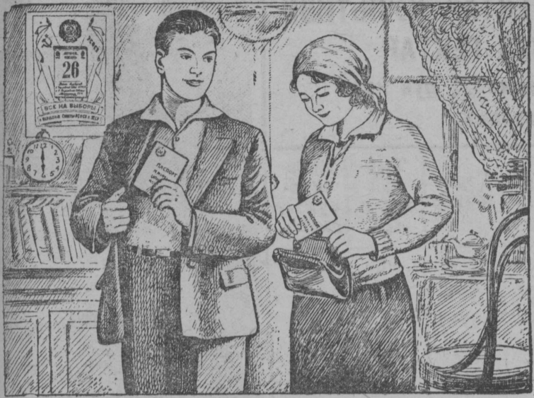
1. Июнь 26 лунэ, РСФСР Верховнэй Совет бэр'ян лунэ бэр'ись любэй кадэ 6 час асысянь и 12 час ойэдз аслаз бэр'ян участок помещеннэй голосуйтэм понда босьтэ ас съэрас либо паспорт, либо профсоюзнэй билет, либо колхознэй книжка, либо удостоверение.