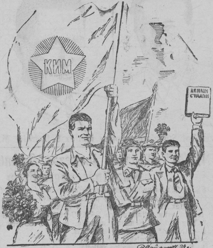
Med olas Sovetskėj molodoz!

Tavoşa godьn Mezdunarnodnėj Junoseskėj Lun dolzen lonь vьd stranaiş revolucionnėj molodozlan vojevəj sploçennost lunən, vojna fasistskėj organizatorrezkət peşan lunən, fasistskėj zavətnikkezşan ispaniskėj da kitajskėj narodəs dorjan lunən. Eta peşəmnь sovetskėj molodoz dolzen zəjmitnь vedussəj mesta.