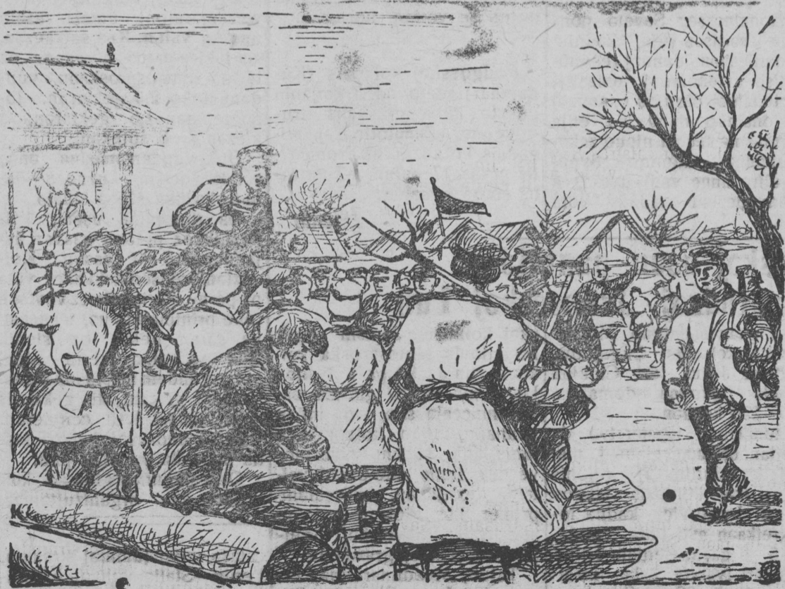
Matrossez da soldattez veşkətlənь krestjanskėj vьstuplennoezən. (Şeņtavr 1917 god) xud. P.Vaşiljevlan kartina vьliş „SSSR-yn grazdanskėj istoria“ medoşa tomis.