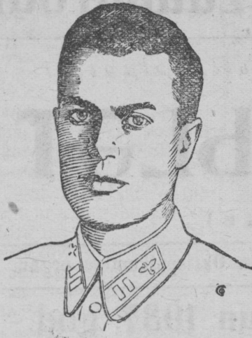
Sovetskaj Sojuzlan gerojjez jorttez S. Daniilin, M. Gromov da A. Jumasev