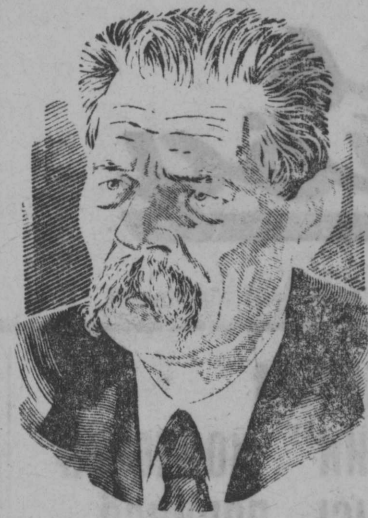
Великий русский писатель Алексей Максимович Горький.