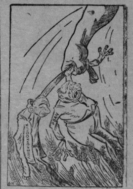
Очистите колхозное поле от сорняков! Рисунок Г. Вальк.

Надгоновые агенты: Грифанов, Шляков, Кушников, Голов, Сычев.