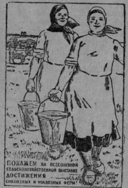
Плакат художника Еремкина выпущенный изд-вом «Искусство» на Всесоюзной Сельскохозяйственной выставке.

Дезорганизатор колхозного труда повысить и уборочную кампанию завершить в срок и без потерь, Шляков игнорирует установленные нормы выработки колхозниками на бригадном собрании—он говорит: «эти нормы выработки не наши, очень большие».