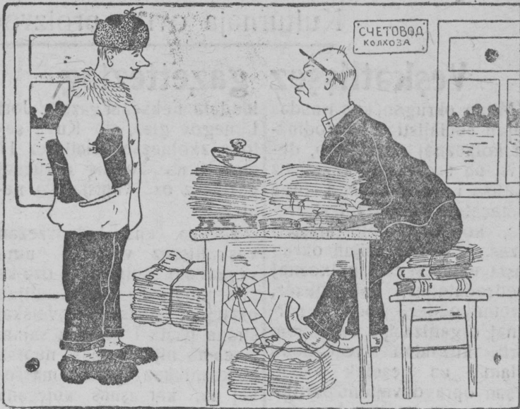
Рис. В. Дусев.

Kәr tijan vәli medvәrja revizija? Eta jьliš te vazolišliš juav, a me tatәn uzala toko mәdik god.