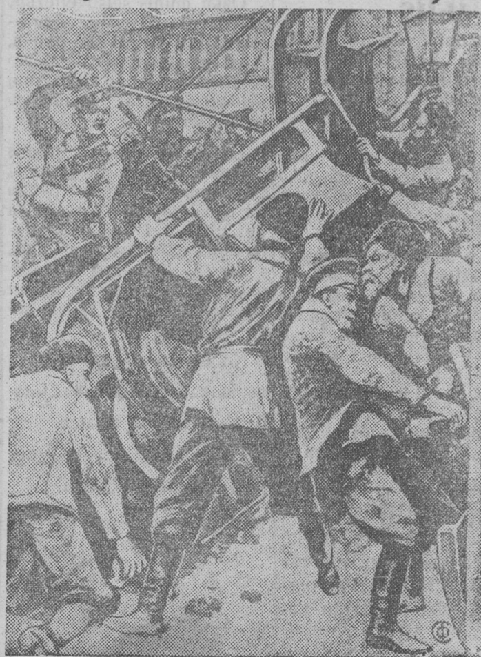
Pēterburgēn, Vašīļjevskēj ostrov vīlībēn barrīkadez. 1) Lē—kosta.

vījāmmezēs. Vīdēnēs ētmēdārē kotra- sīsē: kīn kēskīs raņītē nēs, kīn kossīs rodnējēzēs, kīn gorzīs vījāmmez vīlībēn. —Palāčēzlē proklātijel! —Avu eššā vera vīra car- lē!—Dolōj carē!—kīlīsē sbez vīd ladoršan. Gapon sajēvtčīs. Tēšēcāšā unazēk ravočējēz, nīlān inēz, cēlāč vālīsē vījāmēs etā vīra krešēn- nāē. Ravočējēz ez pōndē veritēn carlē da jenlē. Estān i vērētīsē ravočējēz voļsevīk- kezlīs pravotāsē. Rītnās Vašīļjevskēj ostrov vīlībēn ravočējēz pondīsē kernē barrīkadez i pondīsē pessēnē kīezēn oruzīoēn. Janvar 9 lūn vēli Rošsijān medozzā revolūciālē pondēt- cēmān. Ez udajtčē sek, mījanlē čārķēnē carizm, unīčtozītēn kapītalīsttezēs, pomessīkkezēs. No 1905 godšā revolūcija vēli medbur urokēn, medvī fevral tēišē 1917 godē čārķēnē carēs, a oktābr tēišē vīdsēn unīčtozītēn kapītalīsttezlīs vlāšt. Feodor Boen.