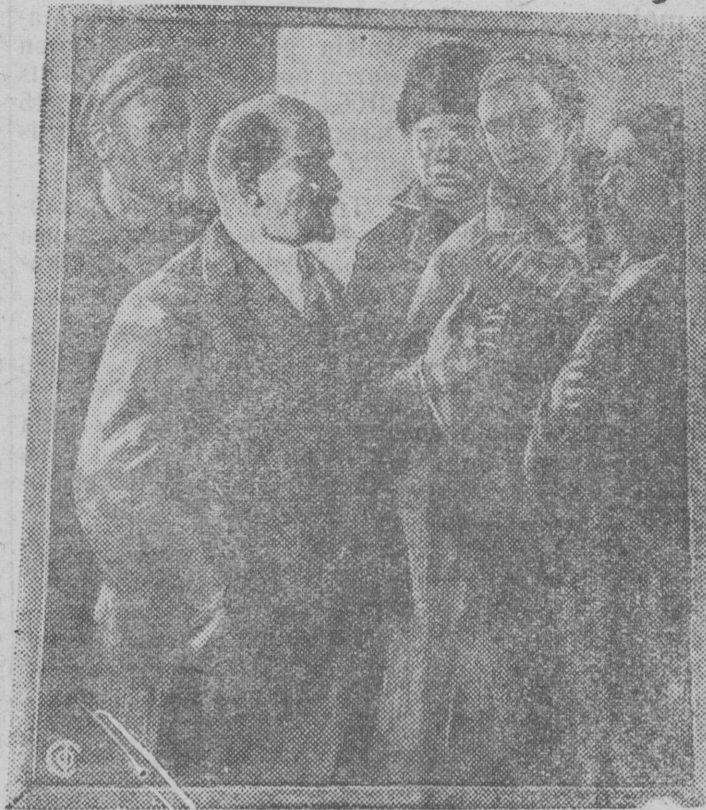
V. I. Lenin šornitē krāsnogvardejecezkēt.

ravočej kīn keris. Munis etā šakēt tuj as/as sīlān vīnā jur. Vīlīšan zar Rošsija vīlē ker— sik lēzšalēm juezēn, tīrāma, sen guļajtē rozga čukār, vītē pletēn dās sīrjēma. No kēt lēz tulēs kadā va, sībšā zēv Rušlēn lēz una. Bokšan te Ruš vīlē vīzēt— i kītčā zar vī en ker, povo rēkēn, on suzēt, kerēs, katorga da rudnīk šer. No i katorga sīz ez-zē sulav, kēz fabričnēj stanok kavala. Vēli vasēk, vogatēs unazēk, ažvīlī strana me čukār. No nēkēs esā mu sōgazēk ez pantašē menēm nēkār. Da čuzāmīš vačkēm vīdēs oz mezdiš, Jonmā sē: —Vīd lētiš te mu ponda i voļā ker! I voštālē vīd buntujtiš odinočka kīn bomba, a kīn revolūver. Carē bur vīdsēn