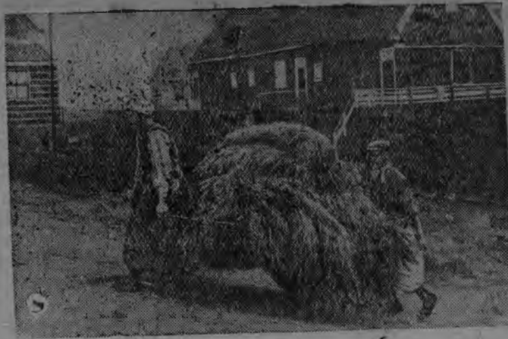
Голландийсь крестьян'ёс вынужденноесь тазы лудвылысь урожаез нуллыны, вал кужым'ёс войнае быремен.