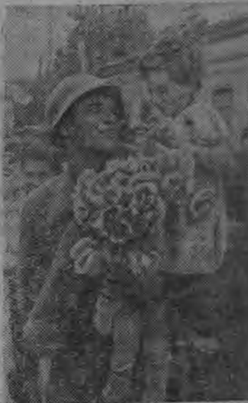
Кишинёво горолысь Александровской ульчаын 2 июле Красной Армилен парадэз но населенилэн демонстрациез состоятся кариськыны Бессарабияез освободить каронэн валче.