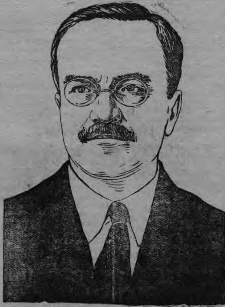
В. М. Молотов

Сталин эшлэн матысь соратникезлэн, ВКП(б) ЦК-лэн Политбюро-езлэн членэзлэн, СССР-лэн Народной комиссар'ёсылэн Советсылэн председателезлэн но иностранной ужпум'ёс'я, Наркомлэн, Вячеслав Михайлович Молотовлэн вурдскем нуналысеныз 50 ар тырмиз.