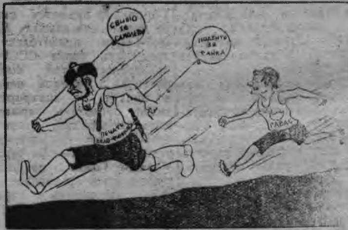
Бело-фин'еслэн пöялэсыкыч'я мировой «рекордзы»

ской перестрелка луылзы. Куазь урод улэмен асьмелэн авиациямы разведывательной лобан'ес гинэ лэстылыз.