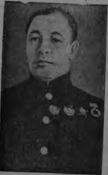
Суред вильны: СССР-лэн Военно-Морской Флотэзлэн Народной Комиссарез Н. Г. Кузнецов.

Красной Военно-Морской Флотлэн краснофлотец'ёсыз, командир'ёсыз но политработник'ёсыз асьсэлэн эпл'ёссылэсь славной традициосэс свято возмало. Асьмелэн границаосмы виль тушмон лыктыз ке, то асьме могущественной флотмылэн боевой корабльёсыз, куд'ёсыз управляться карисько превосходной кадр'ёсын, противникез озы ик пазыгозы, кызы сое пазыгылызы котьку.