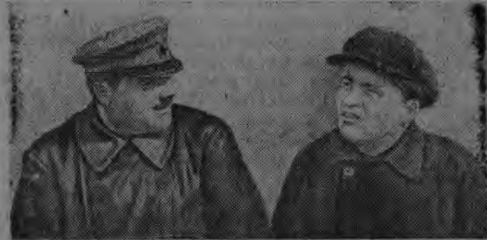
Суред вылын: Климент Ефремович Ворошилов но Сергей Миронович Киров.